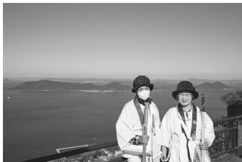
八十四番 屋島寺「獅子の靈巖」より 眺める瀬戸内の海

「締切日です」とのこと！ 幾度もお四国参りに参加させて頂く機会があったにも関わらず、見送ってきただお四国。今回はギリギリ間に合います。考える間もなく参加を決めました。不思議なこと、この度の参加には何の抵抗もなく素直な気持ちで行かせて頂くこととなったのです。もともと出不精な私ですが、まるで誰かに後ろを押されたようです。二泊、三泊の旅など行ったことがないため、どんな準備があるの