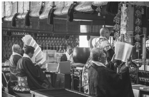
「大般若經典の智慧の風をお受けください」