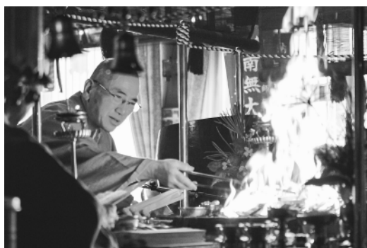
「護摩の炎で災厄を浄めます」